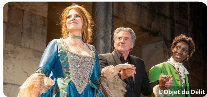
L'Objet du Délit