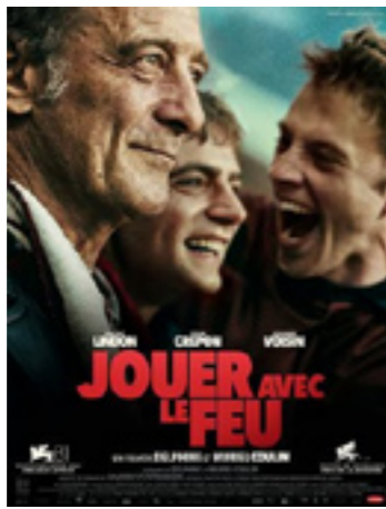
Jouer avec le feu

« Le réalisateur marseillais poursuit son exploration des comportements humains dans une société qui cherche à nous mettre les uns contre les autres. » Première