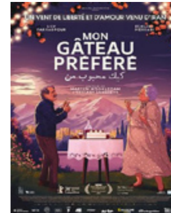
Mon gâteau préféré (Keyke mahboobe man)

« Ce n'est pas la première fois que Pablo Larrain s'attaque à un biopic, puisqu'il a déjà réalisé Neruda (2016) sur le poète chilien Pablo Neruda, Jackie (2016) sur la vie de Jackie Kennedy au moment de l'assassinat du Président Kennedy et Spencer (2021) sur le divorce de Charles III, alors prince de Galles, et de sa première épouse, la princesse Diana Spencer. Néanmoins, Maria conclut son «triptyque de femmes qui ont bouleversé le XXe siècle» selon les propos du cinéaste, et également son premier long-métrage consacré à une artiste. » Note de producton