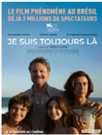
Je suis toujours là (Ainda Estou Aqui)

Brésil, France - 2h15 - 2024 - Présenté en V.O.s.t. - Golden Globe de la Meilleure actrice dans un drame et Meilleur scénario à la Mostra de Venise 2024.