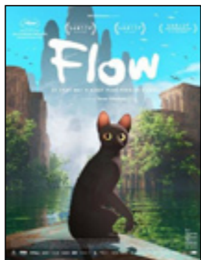
Flow, le chat qui n'avait plus peur de l'eau

C'est l'histoire d'un garçon qui rencontre un tout petit monstre par une nuit de pleine lune. C'est aussi l'histoire d'une famille de capybaras et d'un poussin qui n'aurait jamais dû se rencontrer. Ces histoires, ce sont avant tout des fables sur le bonheur d'être ensemble.