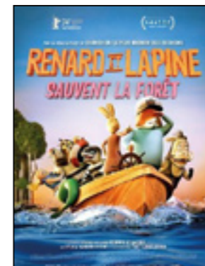
Renard et Lapine sauvent la forêt

« Un choc esthétique et une ode hypnotique à la nature. » Télérama