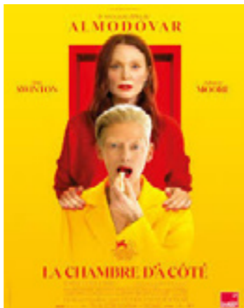
La Chambre d'à côté (The Room Next Door)

« Walter Salles subjugué littéralement les spectateurs dans une fresque familiale vertigineuse qui dissèque avec force les ravages de vingt années de dictature militaire au Brésil. » aVoir-aLire.com