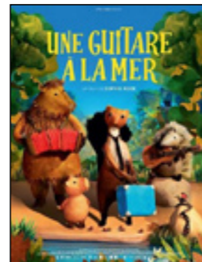
Une guitare à la mer

France, Suisse - 0h56 - 2025 - À partir de 3 ans.