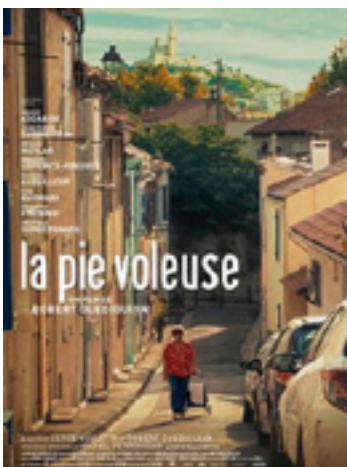
La Pie voleuse

« Un biopic classique mais soigné et plaisant. » Télérama