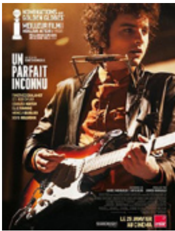
Un parfait inconnu (A Complete Unknown)

U.S.A. - 2h20 - 2024 - Présenté en V.O.s.t.