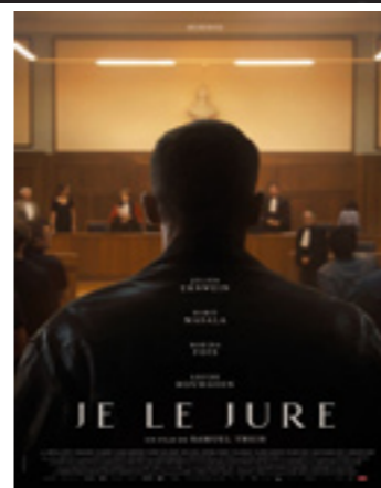
Je le jure