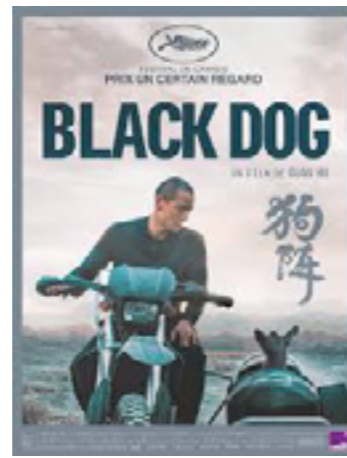
Black Dog (Gou Zhen)

Chine - 1h50 - 2024 - Présenté en V.O.s.t. - Prix Un Certain Regard au Festival de Cannes 2024.