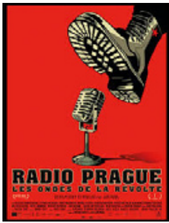
Radio Prague, les ondes de la révolte (Viny)

République tchèque, Slovaquie - 1h56 - 2024 - Présenté en V.O.s.t.