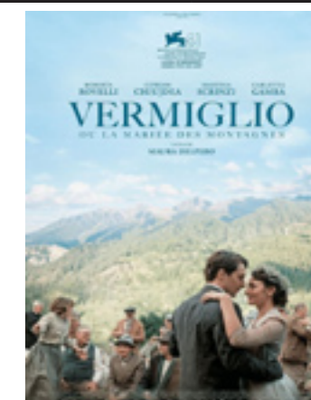
Vermiglio ou La Mariée des Montagnes

Italie, France, Belgique - 1h59 - 2024 - Présenté en V.O.s.t. - Lion d'Argent - Grand Prix du Jury à la Mostra de Venise 2024.