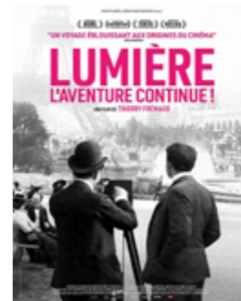
Lumière l'aventure continue