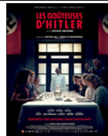
Les Goûteuses d'Hitler (Le Assaggiatrici)

Italie, Belgique, Suisse - 2h03 - 2025 - Présenté en V.O.s.t.