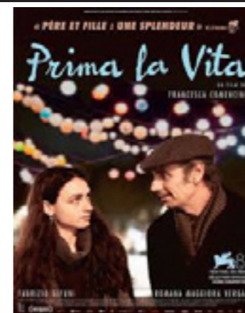
Prima la vita