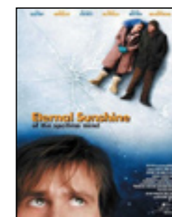
Eternal Sunshine of the Spotless Mind

Ciné Club des Lycéens Jeudi 13 février à 18h30