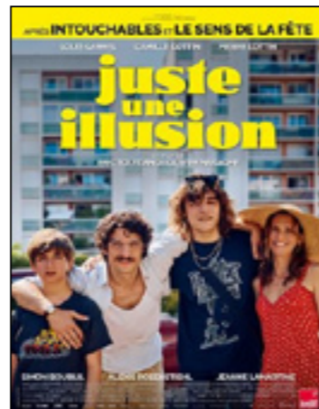
Juste une illusion

« Dans la lignée du déjà très beau Cœur battant de Roberto Minervini (qui mêlait lui aussi le vrai, le faux et le rodéo), The New West passionne autant pour ce qu'on voit à l'écran que pour les trésors d'ingéniosité et de sensibilité qu'il a dû falloir déployer en coulisses pour le rendre possible. » Première