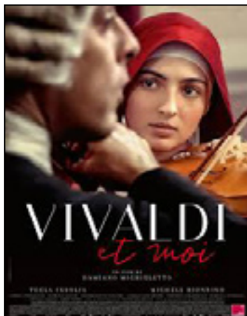
Vivaldi et moi (Primavera)

Italie, France - 1h51 - 2025 - Présenté en V.O.s.t. - Film de clôture de la Quinzaine du Cinéma Italien 2025 !