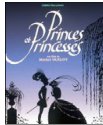
Princes et princesses

Ernest et Célestine retournent au pays d'Ernest, la Charabie, pour faire réparer son précieux violon cassé. Ils découvrent alors que la musique est bannie dans tout le pays depuis plusieurs années. Pour nos deux héros, il est impensable de vivre sans musique ! Accompagnés de complices, dont un mystérieux justicier masqué, Ernest et Célestine vont tenter de réparer cette injustice afin de ramener la joie au pays des ours.