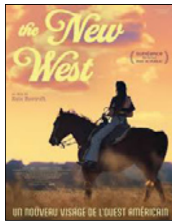
The New West (East Of Wall)

« Une vision aussi burlesque que délicate de la complexité des liens familiaux, baignée dans la zénitude japonaise. » aVoi-aLire.com