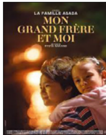
Mon grand frère et moi (Ani wo mochihakoberu saizu ni)

« Cette rencontre entre un indigène poussé à la rue par les autorités locales et une riche intellectuelle essouffée et malade est tout simplement un petit joyau de poésie, de beauté et d'émotions. » aVoi-aLire.com