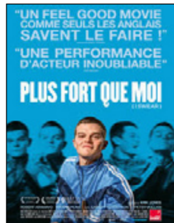
Plus fort que moi (I Swear)

« Un extraordinaire poème visuel et sonore sur la musique et, plus encore, sur la puissance créatrice du collectif. » Positif