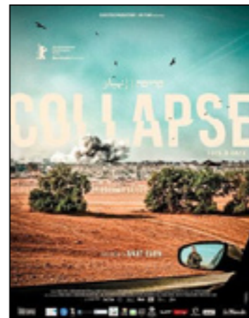
Collapse (Face à Gaza)

« Un film qui fait du bien de bout en bout. » Positif