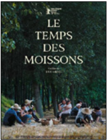
Le Temps des moissons (Sheng xi zhi di)

« La Petite Cuisine de Mehdi a un parfum délicat, différent, qui fait mouche souvent. » Bande à part