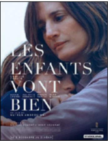
Les Enfants vont bien

« Ce premier long métrage de fiction, présenté à la Quinzaine des cinéastes au dernier Festival de Cannes, nous entraîne dans un univers organique fascinant, bâti sur des contrastes. » Télérama