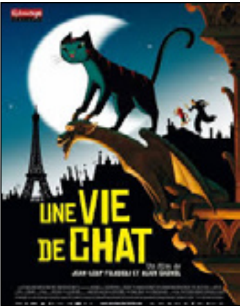
Une vie de chat

Ernest, un gros ours musicien, vit avec Célestine, une petite souris orpheline. Ensemble, ils ne s'ennuient jamais ! L'hiver approche, et il faut tout préparer avant l'hibernation d'Ernest : aider leur oie Bibi à partir, danser au bal des souris et surtout... cuisiner de bons gâteaux pour dormir le ventre plein !