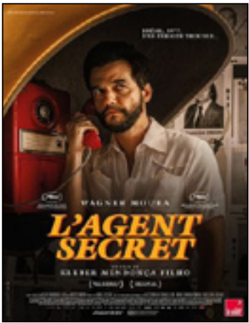
L'Agent secret O Agente Secreto

Brésil, France, Pays-Bas - 2h40 - 2025 - Présenté en V.O.s.t. - Tout public avec avertissement - Prix de la mise en scène et d'interprétation masculine au Festival de Cannes '25.