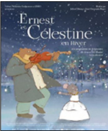
Ernest et Célestine en hiver

France - 0h45 - 2016 - À partir de 3 ans.