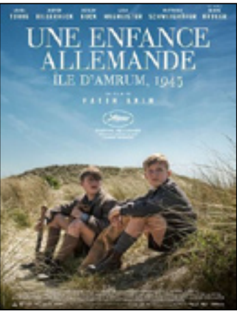
Une enfance allemande - Île d'Amrum, 1945 (Amrum)

« Dossier 137, porté haut par Léa Drucker, aussi précise, vive que lumineuse, et un casting en tout point impeccable, est un grand film, dont la résonance vous hante longtemps après son générique achevé. » Bande à part