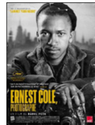
Ernest Cole, photographe