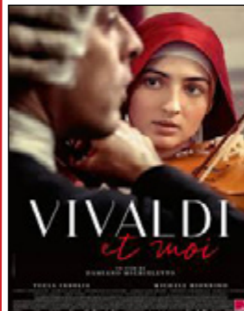
Vivaldi et moi (Primavera)

Italie, France - 1h51 - 2025 - Présenté en V.O.s.t. - Film de clôture de la Quinzaine du Cinéma Italien 2025 !