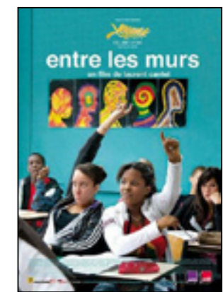
Entre les murs

France - 2h08 - 2008 - Séance en présence de M. Youssef BADR, Magistrat à Bobigny - Porte Parole du Ministère de la Justice de 2017 à 2019. Créateur de l'association « La Courte Echelle » pour la promotion de tous les jeunes. En partenariat avec le Lycée Monge. Précédée d'une conférence-débat au lycée Monge à 18h.