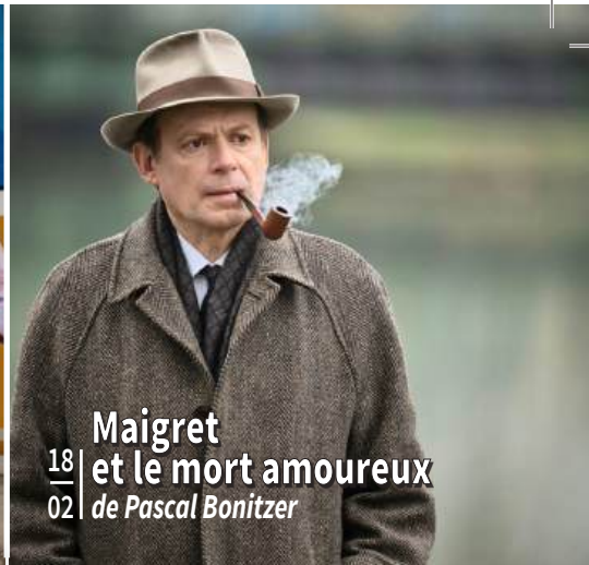
18 | Maigret et le mort amoureux 02 | de Pascal Bonitzer