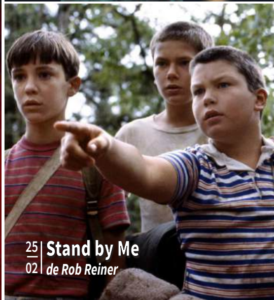
25 | Stand by Me 02 | de Rob Reiner