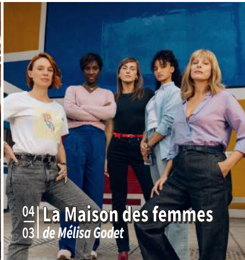
04 | La Maison des femmes 03 | de Mélisa Godet