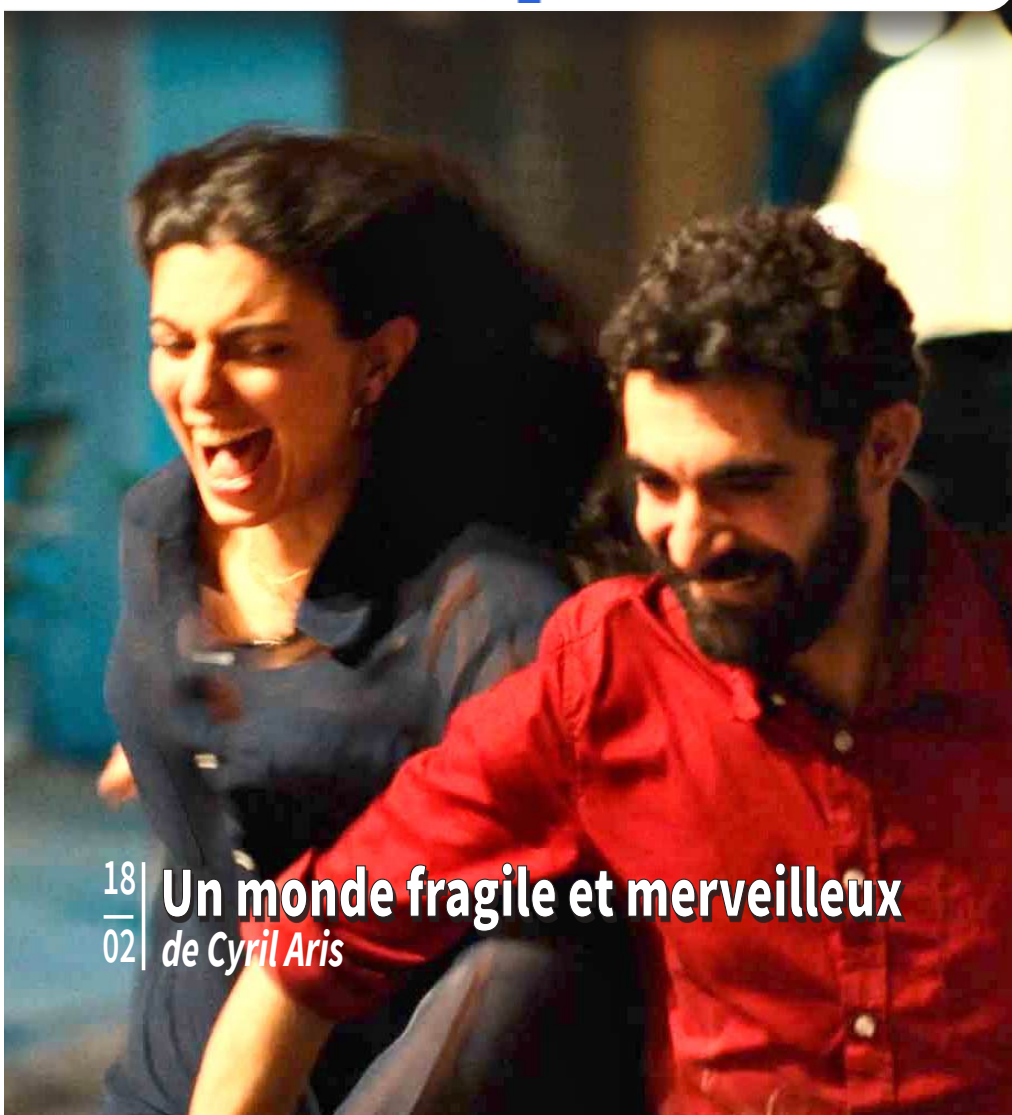
18 | Un monde fragile et merveilleux 02 | de Cyril Aris

Programme n°313 du 11 février au 10 mars 2026