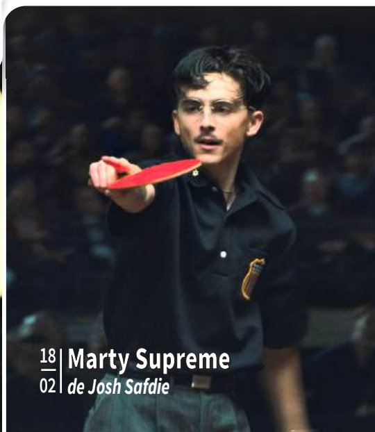
18 | Marty Supreme 02 | de Josh Safdie