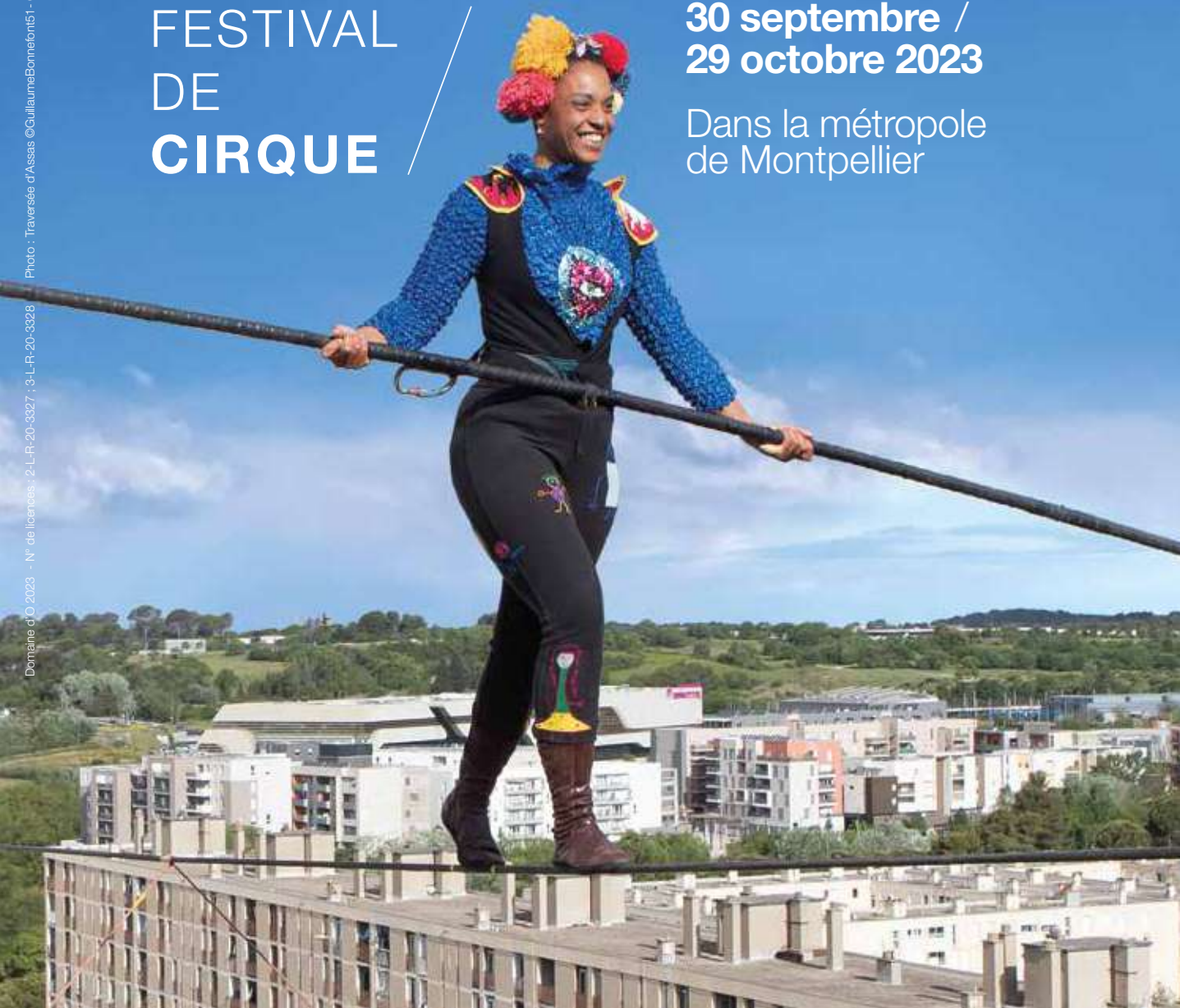
Photo : Traversée d'Assas ©GuillaumeBonnefont151 - Cie Basinga - grafismdo

Domaine d'O 2023 - N° de licences : 2-L-R-20-3327 ; 3-L-R-20-3328