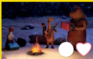
Une guitare à la mer