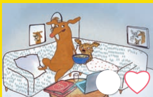
Nous voilà grands !