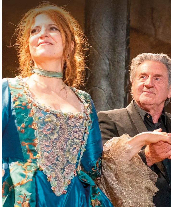
L'OBJET DU DÉLIT

véo CINÉMA MURET PROGRAMME N.611 27 MAI 02 JUN 2026