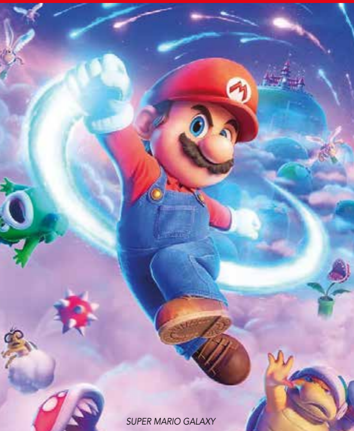
SUPER MARIO GALAXY

PROGRAMME N° 13 DU 25 MARS AU 7 AVR. 2026