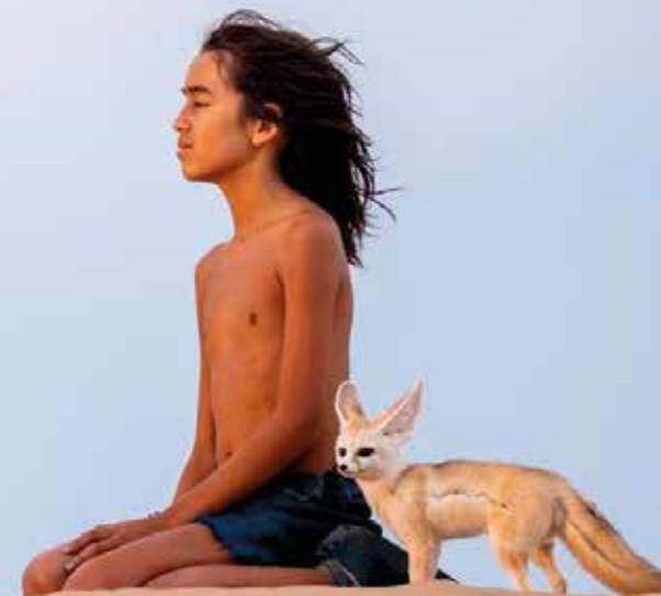
L'ENFANT DU DÉSERT