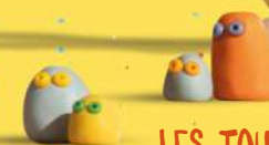
LES TOUTES PETITES CRÉATURES