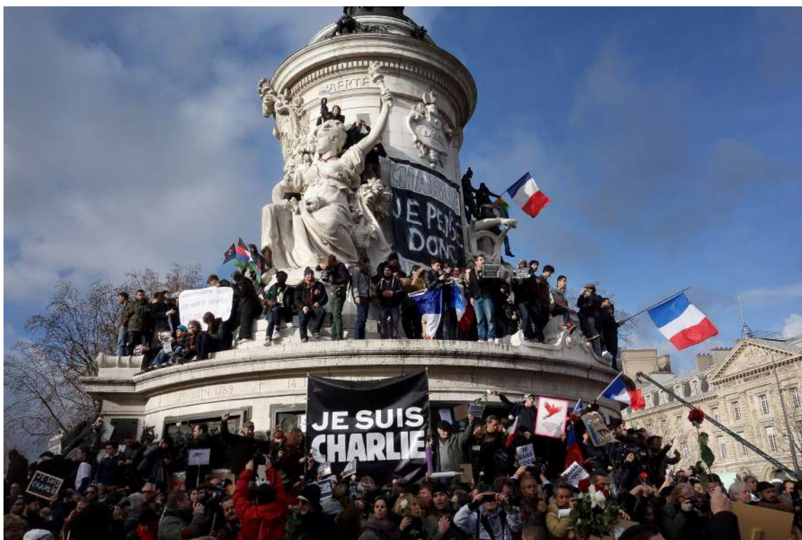
Rassemblement, Place de la République, Paris, 11 janvier 2015 © Olivier Ortelpa, #jesuischarlie, Wikimedia Commons

Cet événement a été suivi d'une forte mobilisation en France et à l'international, notamment lors de rassemblements en hommage aux victimes et en soutien à la liberté d'expression.