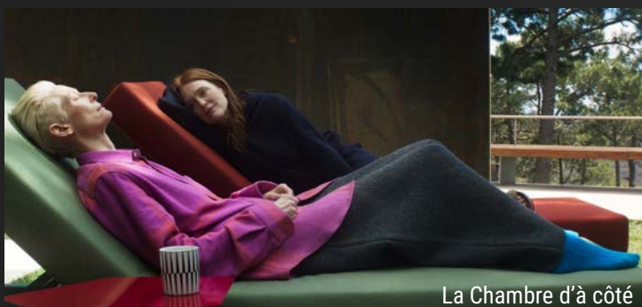
La Chambre d'à côté

Changement dans la programmation, les films seront diffusés pendant 2 semaines minimum. La dernière séance est soulignée dans la grille horaire.