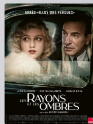
Les Rayons et les ombres