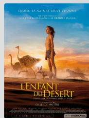
L'Enfant du désert