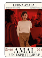
AMAL UN ESPRIT LIBRE