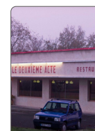
LE DEUXIÈME ACTE