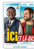
ICI ET LÀ-BAS