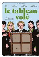
LE TABLEAU VOLÉ