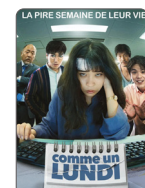
COMME UN LUNDI