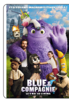
BLUE & COMPAGNIE