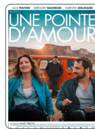
UNE POINTE D'AMOUR