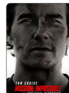
MISSION IMPOSSIBLE THE FINAL RECKONING