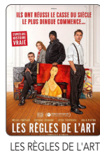
LES RÈGLES DE L'ART