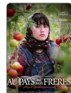
AU PAYS DE NOS FRÈRES