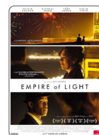
EMPIRE OF LIGHT