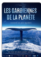
LES GARDIENNES DE LA PLANÈTE