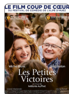
LES PETITES VICTOIRES