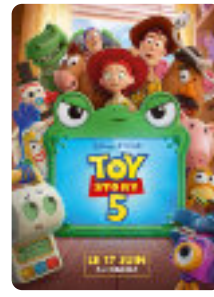
Toy Story 5