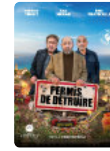
Permis de détruire