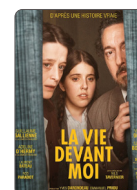
LA VIE DEVANT MOI À PARTIR DU 26/02