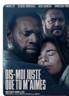
DIS-MOI JUSTE QUE TU M'AIMES