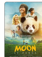
MOON LE PANDA À PARTIR DU 09/04