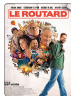
LE ROUTARD À PARTIR DU 02/04