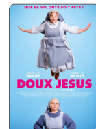
DOUX JÉSUS À PARTIR DU 09/04