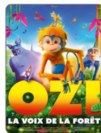
OZI, LA VOIX DE LA FORÊT À PARTIR DU 02/04