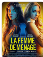
LA FEMME DE MÉNAGE