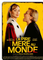
LA PIRE MÈRE AU MONDE