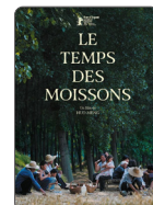
LE TEMPS DES MOISSONS