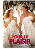
POUR LE PLAISIR