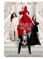
LE DIABLE S'HABILLE EN PRADA 2