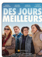
DES JOURS MEILLEURS À PARTIR DU 23/04